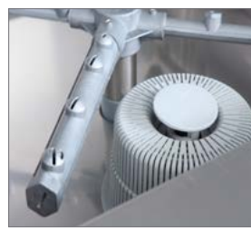
Filtros y brazos de lavado fabricados en PVC alimentario y fibra de vidrio 30%.