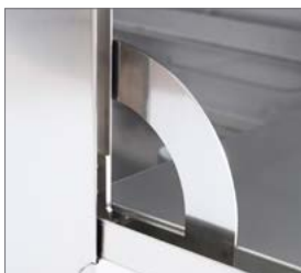
Bisagra reforzada para mayor durabilidad.