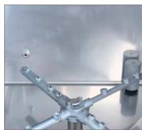
Terminación curva para mayor higiene. Guías desmontables. Orificio pre-instalación detergente. Doble filtro.