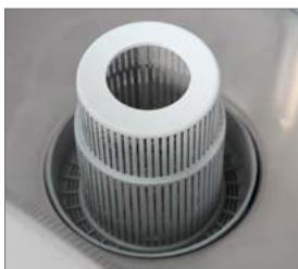
Sistema de filtrado dFilter de doble eficacia, garantizando un lavado óptimo.