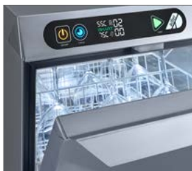
Display digital visual e intuitivo.