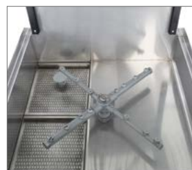
Filtros de acero inox y tapón rebosadero que facilita la limpieza interior alargando la vida de la máquina.