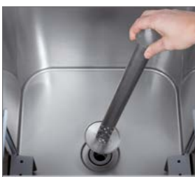
Sistema de desagüe para renovación de agua.

1 AÑO GARANTÍA Condicionada a uso, producto e instalaciones adecuadas.