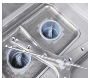
Brazos en acero