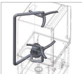
Bomba de doble flujo.

1 AÑO GARANTÍA Condicionada a uso, producto e instalaciones adecuadas.