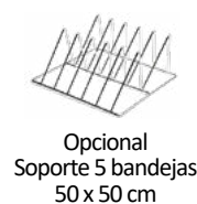
Opcional Soporte 5 bandejas 50 x 50 cm